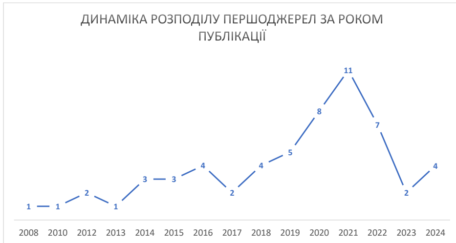
Рис. 1. Розподіл досліджуваних публікацій за роком видання