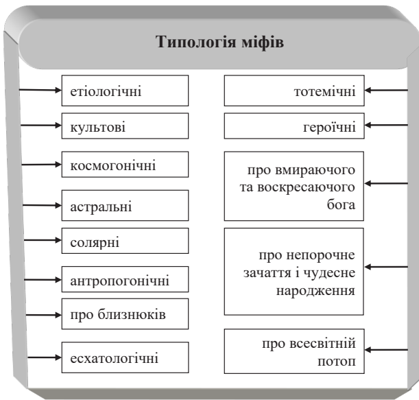
Рис. 1. Типологія міфу

Кожна окрема міфологія має певний зв'язок з релігією, художньою творчістю, фольклорними традиціями тощо, певним чином відображають культуру народу, їх традиції, характерний світогляд. У сучасному світі міф розглядається як «альтернатива наукового мислення» (Павлюк, 2006, с. 90).