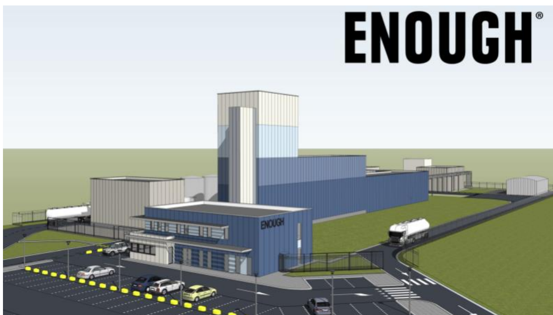
Рис. 2. Схема побудованого фірмою Enough заводу в Нідерландах для мікробного перетворення органічних відходів у білковий волокнистий продукт Abunda

Наголосимо на тому, що через повне ігнорування бактеріальних та інших ноотехнологій учасники Давосу-2022 не змогли запропонувати засоби ліквідації голоду в бідних країнах, поклавши всі надії на експорт з України врожаю 2021 року. Сконцентруємося на доведенні помилок «давоських лоцманів» і вкажемо на існування реального способу перемоги над браком тваринних і рослинних білків у світі. Пропонуємо на рис. 2 рекламне повідомлення з невеликими поясненнями.