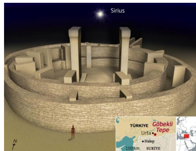
Рис. 3. Реалізація ідеї просторової і часової орієнтації в кільцевих храмах-обсерваторіях

4. Досконала з самої своєї появи кільцева модель Всесвіту в Гебеклі-Тепе забезпечувала успішність виховного впливу на молодь і формування в їх головах уявлення про закони Природи та глибокого усвідомлення необхідності відмови від знищення інших Хомо, адже вони не тварини, а також належать до обранців Небес. Цілком незаперечним фактом є спорудження 13 500 років великою групою наших і європейських пращурів найпершого «храму-обсерваторії» у формі кільця з великих плоских каменів. В його центрі ставили величезні Т-подібні плити з різноманітним різьбленням. Тому усередині споруди навіть у повній темряві легко визначали сторони світу, а в момент появи чи зникнення сонячного диску з непоганою точністю орієнтувалися щодо днів року. Рис. 3 вказує ідею виділення напрямку на Полярну (тоді це був яскравий Сиріус) і визначення інших сторін світу.