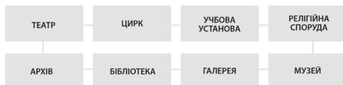
Схема 1. Образна модель устрою блоків пам'яті людини за Г. Поповим як результат застосування зовнішнього методу вивчення пам'яті.

б установи, об'єкти ми могли би віднести до пам'яті?» [4, с. 33]. За суттю, Г. Попов першим запропонував розглядати існуючі інститути пам'яті, як об'єктивовані результати успішної діяльності в суспільстві, як закріплені соціальні відносини пам'яті.