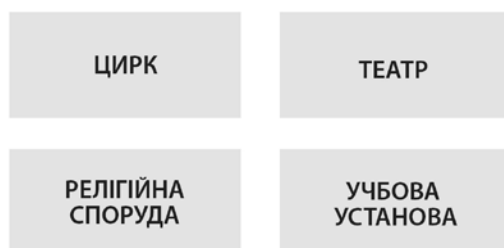
Схема 2. Динамічні блоки пам'яті

відбувається і такі, в яких вже нічого не відбувається і не перетворюється, тільки фіксується і зберігається», - цитата з рукопису «Три підходи до вивчення пам'яті» [4]. В контексті дослідження феномена часу нам, в першу чергу, потрібно вивчати динамічні блоки пам'яті.